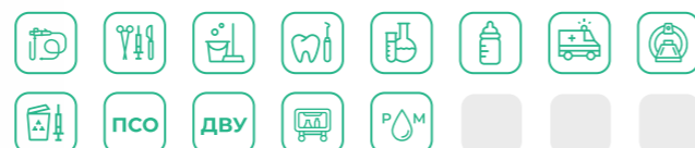
Средства для эндоскопии торговой марки Xion

Аниоксид 1000, Стерокс Окси, Клиндезин-Окси, Асесайд (Acicide), МИРОКСИД - 2000