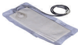
Дренаж впитывающий S – 9,6x9,8 см M – 14,4x14,4 см L – 30x15 см