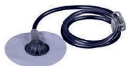
Дренаж 80 см