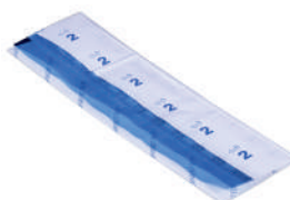
Инцизная пленка 30x36 см