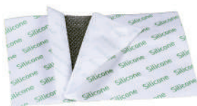
Атравматическое покрытие S – 15x10 см M – 19,9x21 см